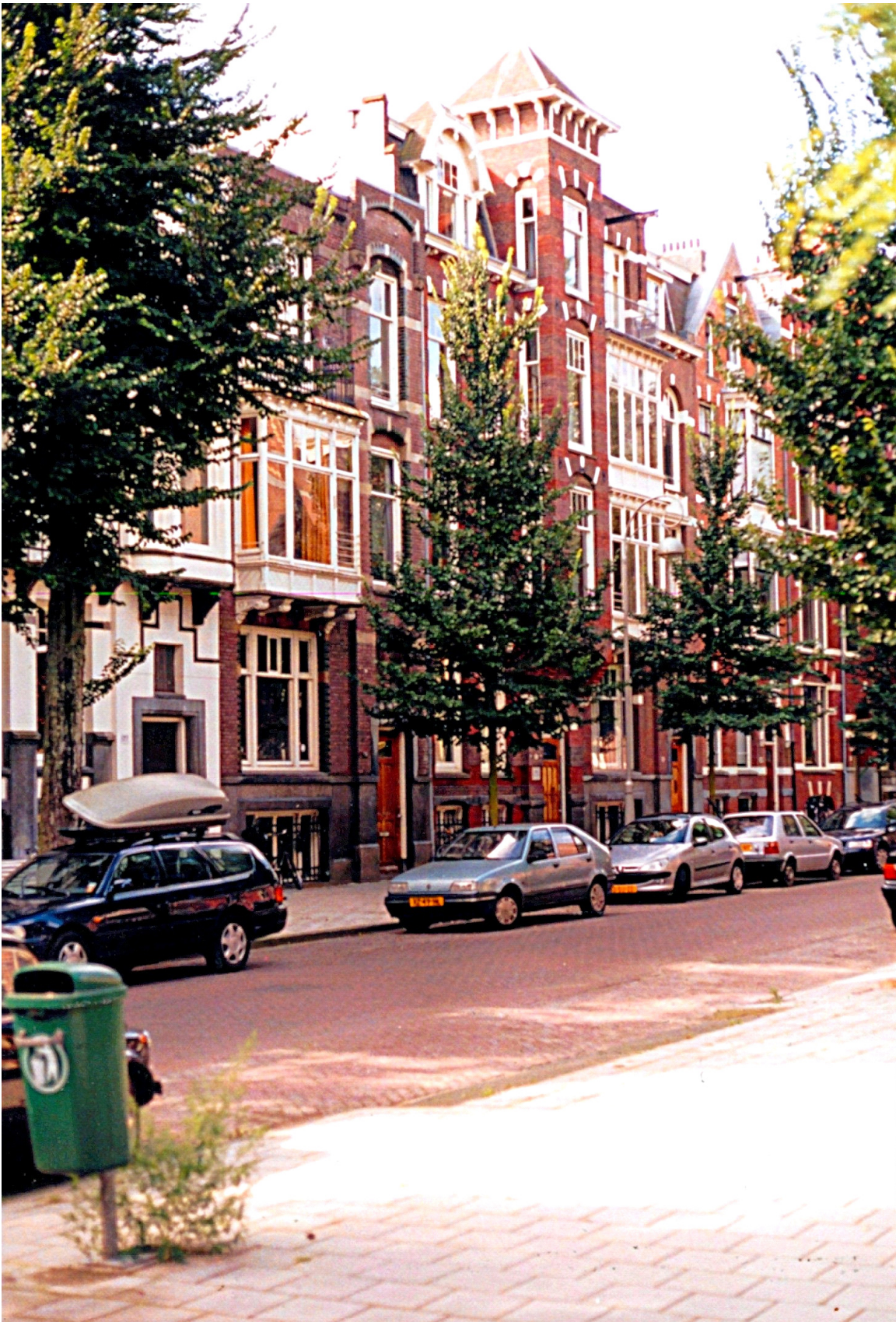
Het pand (179) van het meest zichtbare raam tussen de bomen, links op de foto, is het voormalige instituut Amsterdam. Het pand (183) zichtbaar links tussen de bomen is de voormalige LZK school. Foto is 200 gemaakt.